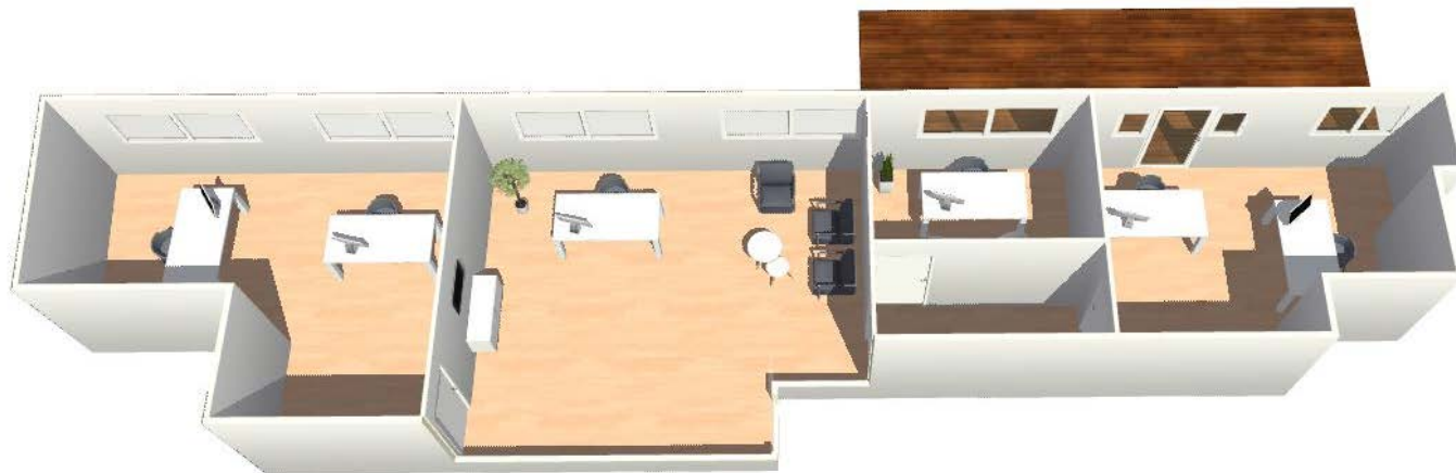
[ PROPOSITION D'AMÉNAGEMENT ]