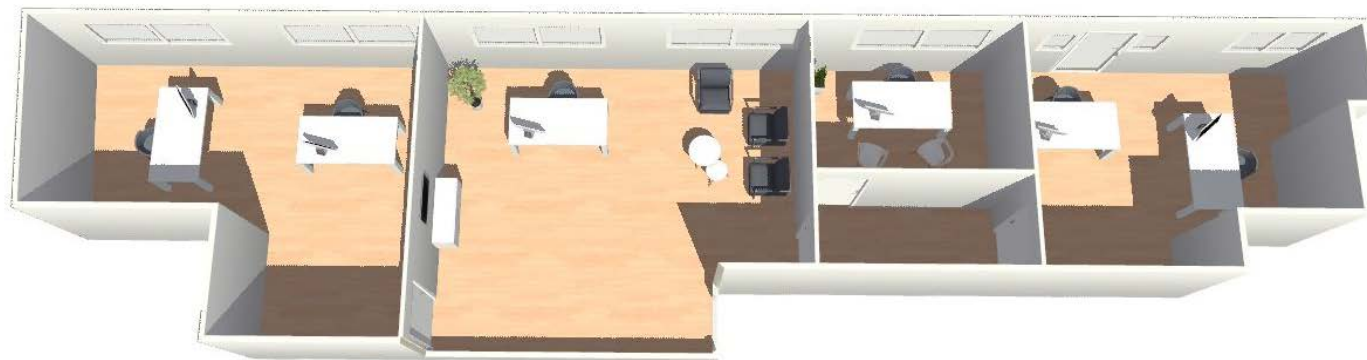
[ PROPOSITION D'AMÉNAGEMENT ]