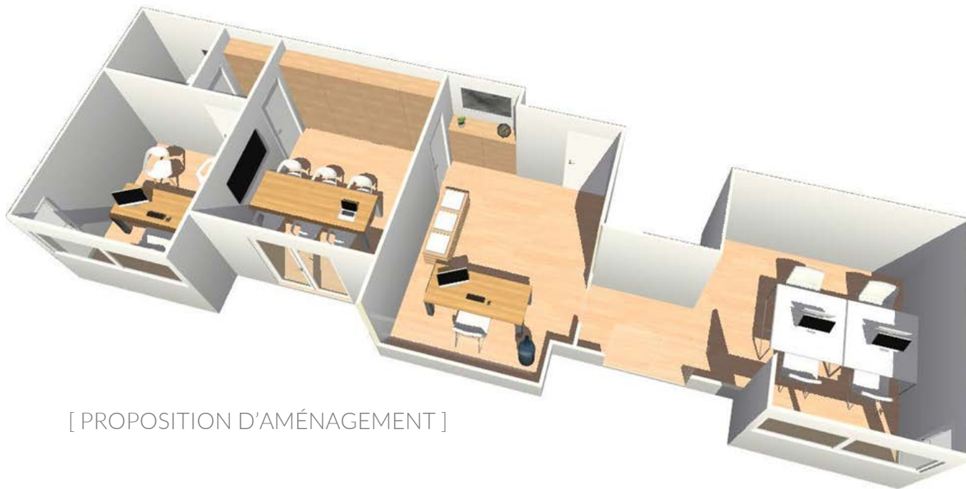
[ PROPOSITION D'AMÉNAGEMENT ]